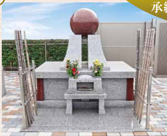
合祀型永代供養墓