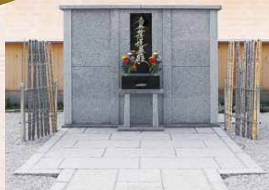
骨壺型永代供養塔