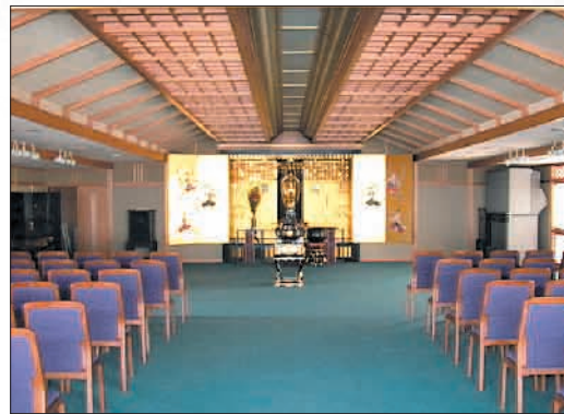
厳かさと優しさ! 白蓮華堂には350名収容のホールがあり 荘厳華麗な雰囲気があります。