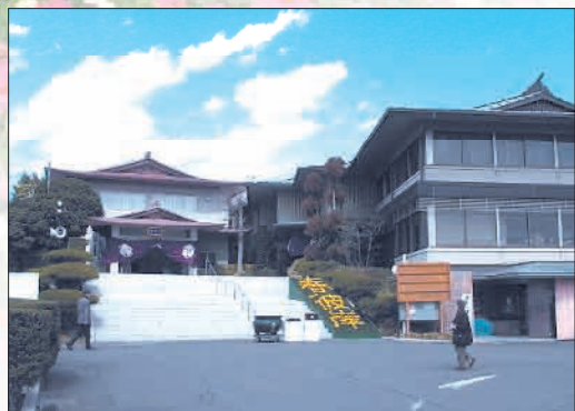
右…白蓮華堂(管理事務所)、左…礼拝堂