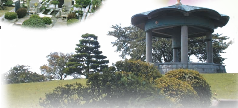
正門近くの天翔の鐘